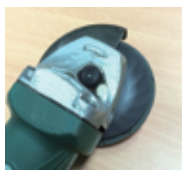
専用バックアップパッド付属

次世代型セラミック砥粒『SGブレイズ®』を非常に耐久性の高いバルカナイズドファイバーに塗布し、豪快な研削力を発揮するファイバーディスク。エアフローに優れる専用のバックアップパッドに取り付けて使用します。